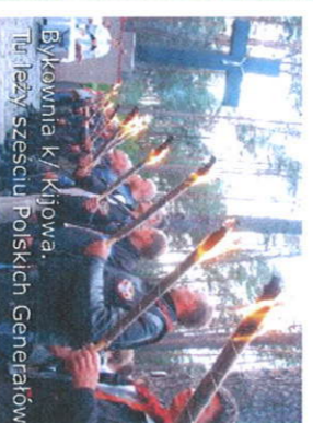
Bykownia K/ Kijowa. Tu leży sześciu Poliskich Generatów.