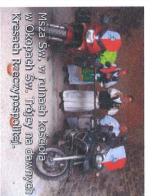
Msza św. w ruinach kościoła w Okopach św. Trójcy na dawnych Kresach Rzeczypospolitej.