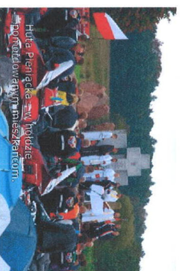
Huta Pieniacka – w podziemiu porzucił powstanie mieszkancom.