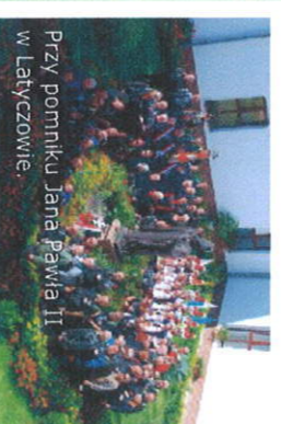
Przy pomniku Jana Pawła II w Łatyczowie.