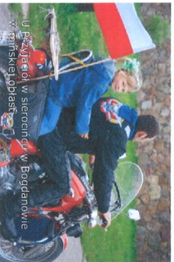
U Pszajscioł w sierocinicy w Bogdanowie w mińskiej okolicy.

Uroczysty start XIII Rajdu Katyńskiego nastąpi 24 sierpnia br. o godz. 9:00, sprzed Grobu Nieznanego Żołnierza w Warszawie Zakończenie 15 września o godz. 11:30 w tym samym miejscu - uczestniczymy w Uroczystej Zmianie Warty. Zapraszamy wszystkich bardzo serdecznie!